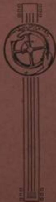
SHIPE, su "Scot., — 1° arrivato