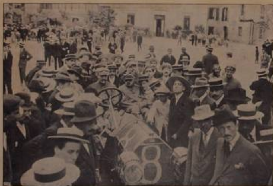
GRAVERO, su "Floria", — 10° arrivato