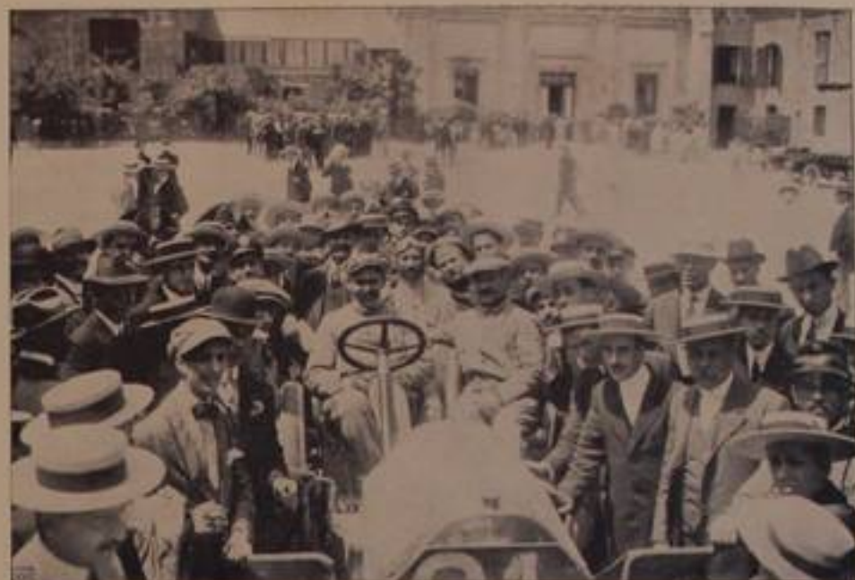
LOSA, su "Pazzara,, - 12° arrivato