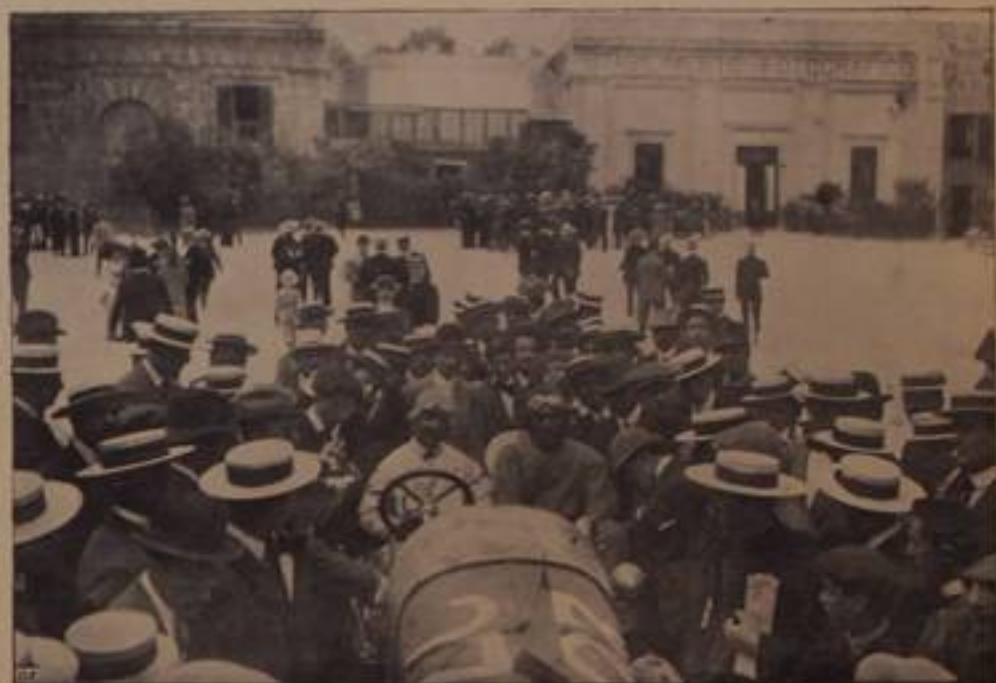
SORDI, su "Florentia,, — ritirato