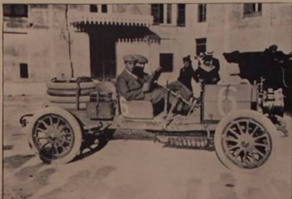
VANNUCCI, su "Italo,, — ritratto