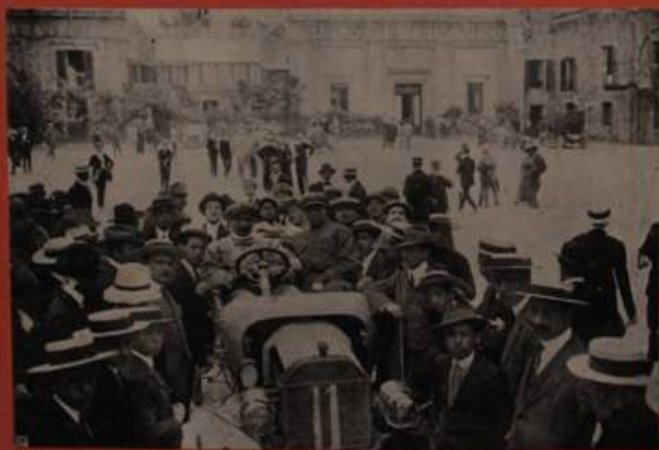
FRACASSI, su "Ford," — 6° arrivato