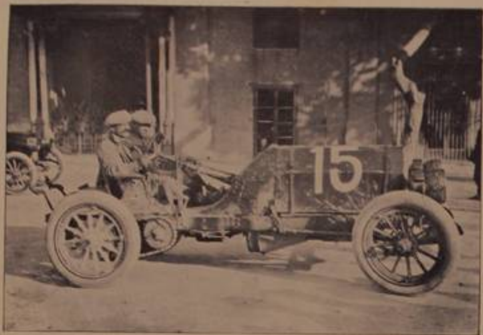
PRIMAVERSI, su "Primavesi,, - 15" arrivato