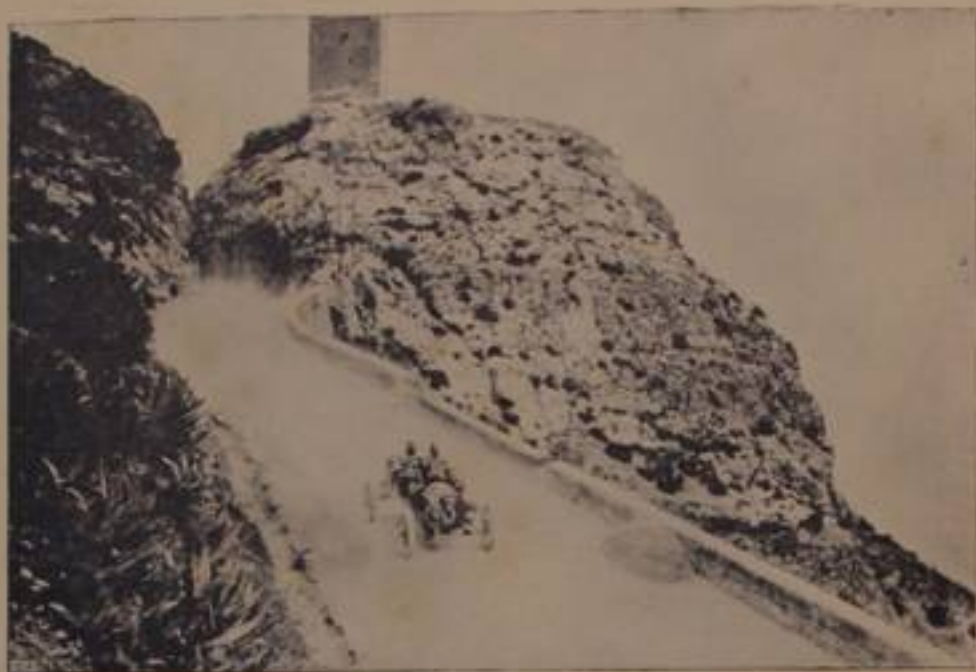
ZAVAGNO, su "Fiat., — ritirato