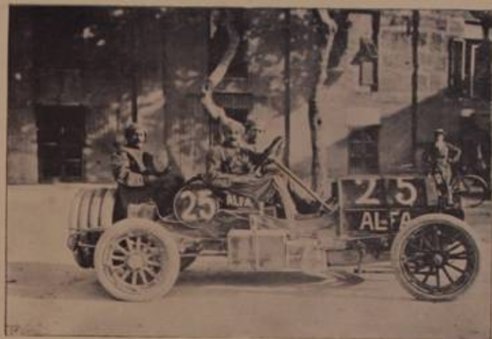
BALDONI, su "Alfa,, - ritirato