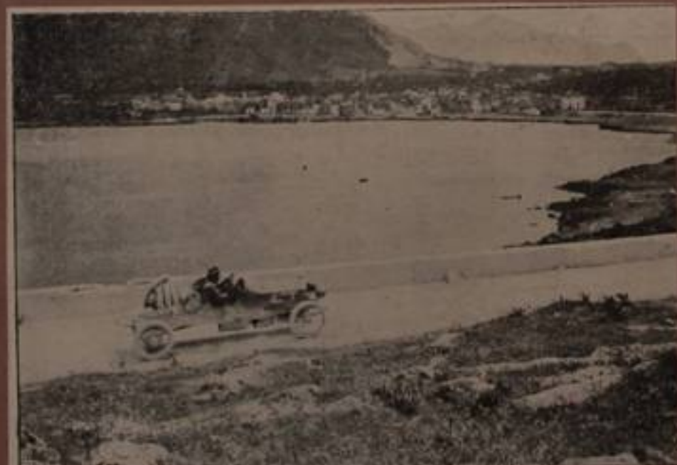
SHIPE, su "Scat.", — 1° arrivato