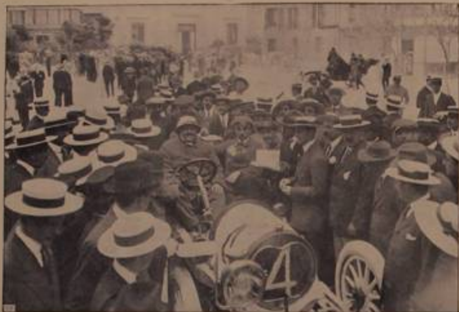
DE PROSPERIS, su "Sigma,, - 11° arrivato