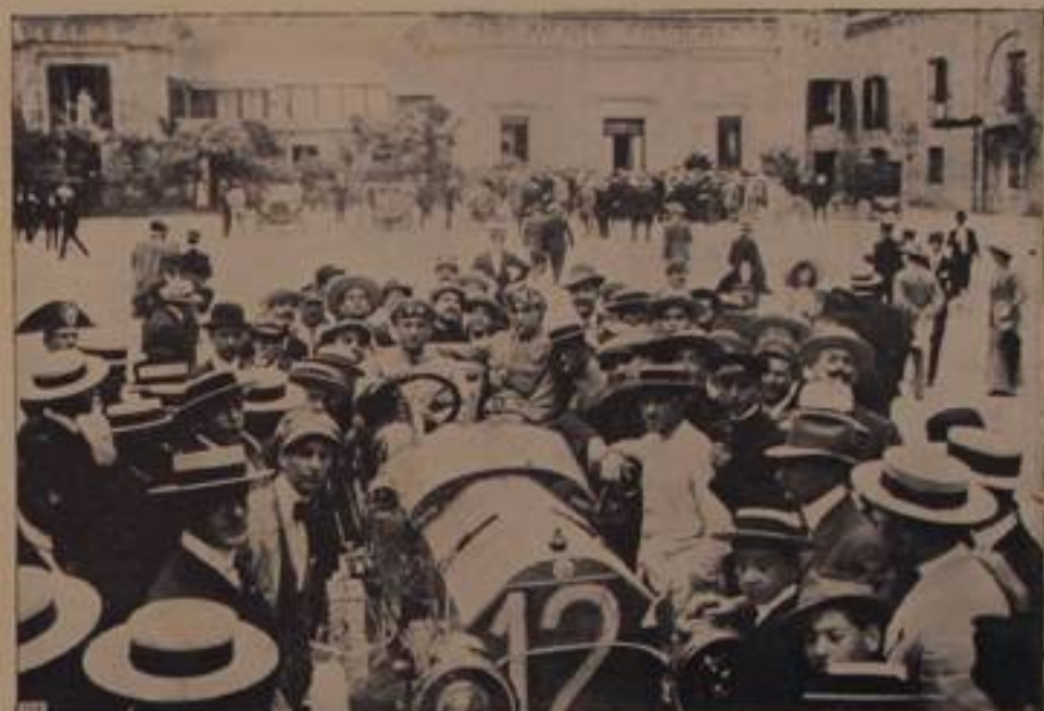
ARNONE, su "Isotta Fraschini", — 9° arrivato