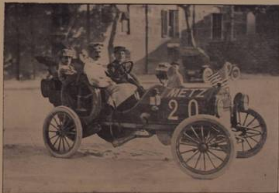
CARRECA, su "Metz,, - ritirato