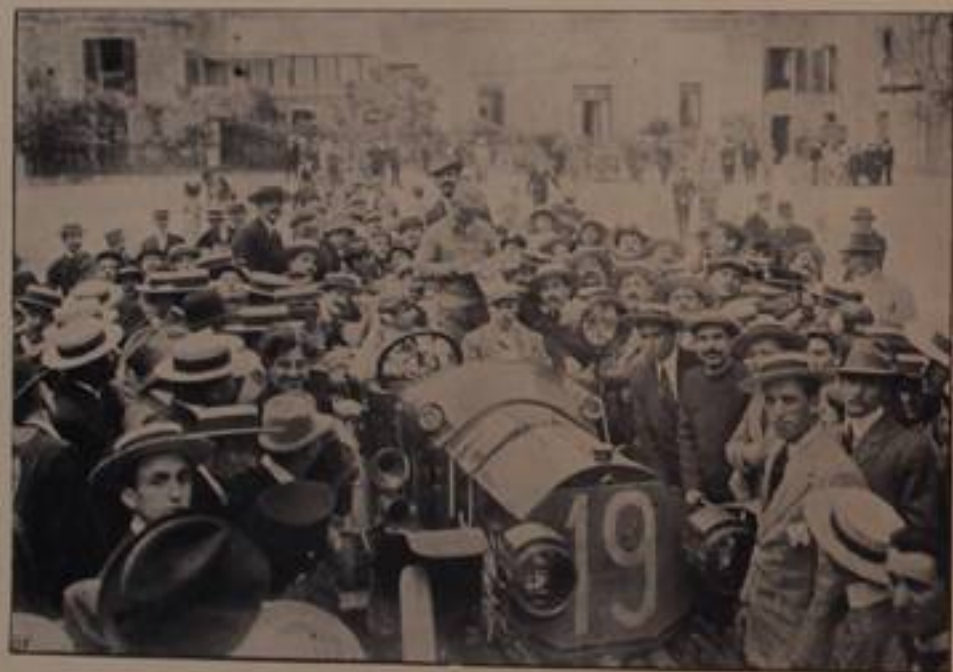
AIROLDI-FLORIO, su "Mercedes.,