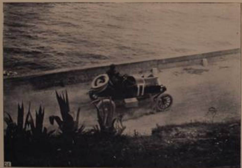
LOMBARDO, su "Overland,, - 13° arrivato