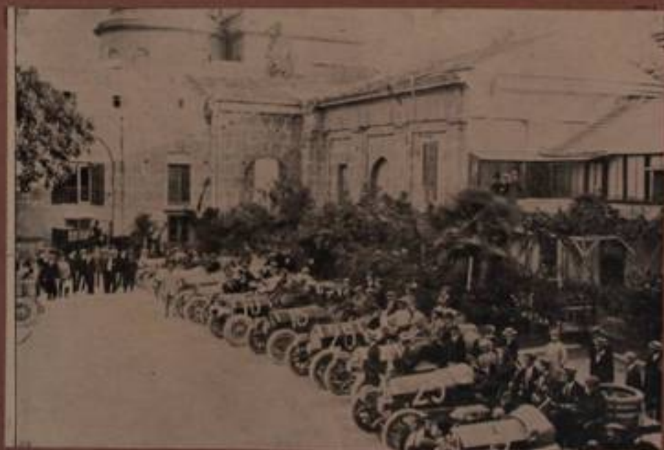
Le vetture al Palazzo Villarosa prima della partenza