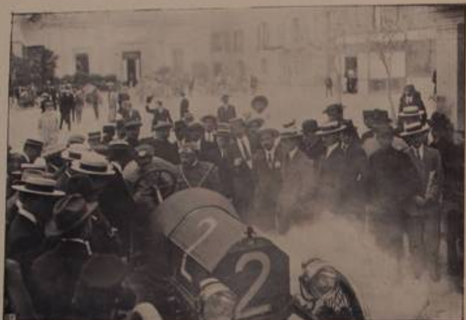
CEIRANO, su "Scat., — ritirato