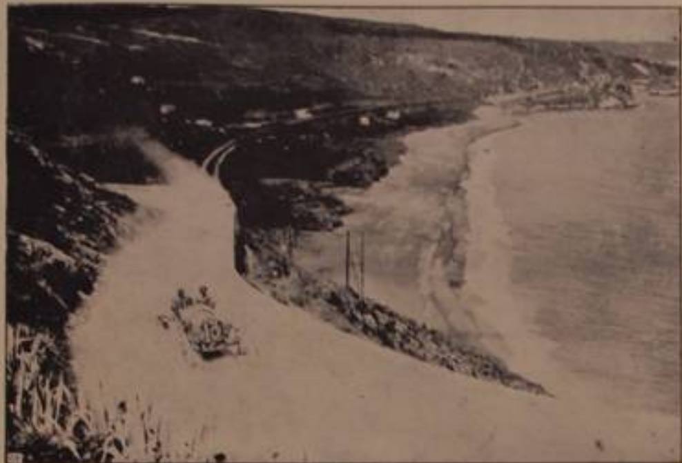
SANDONNINO, su "Scal,, — ritratto