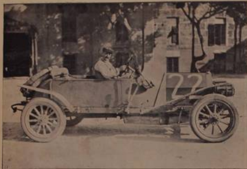
TROMBETTA, su "Fiat", — 8° arrivato