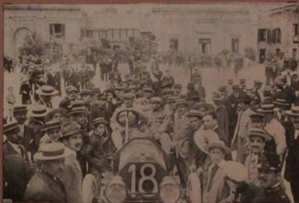
GARETTO GUGLIEMINETTI, su "Lancia", — 2° arrivato