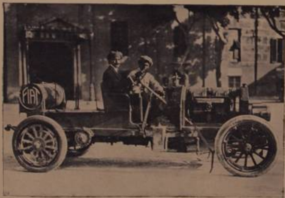
LO FASO, su "Fiat,, - ritirato