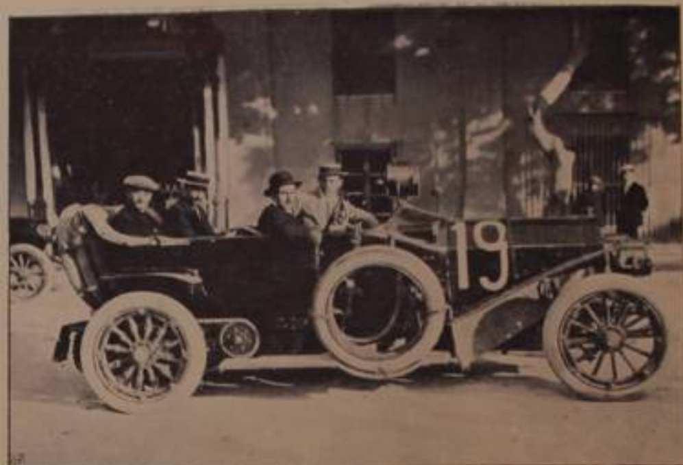
AIROLDI-FLORIO, su "Mercedes., — ritirato