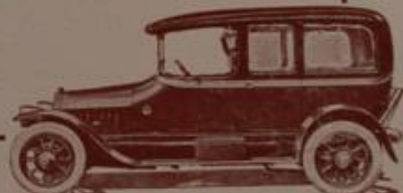
Limousine su Chassis P. C. S. 40 HP