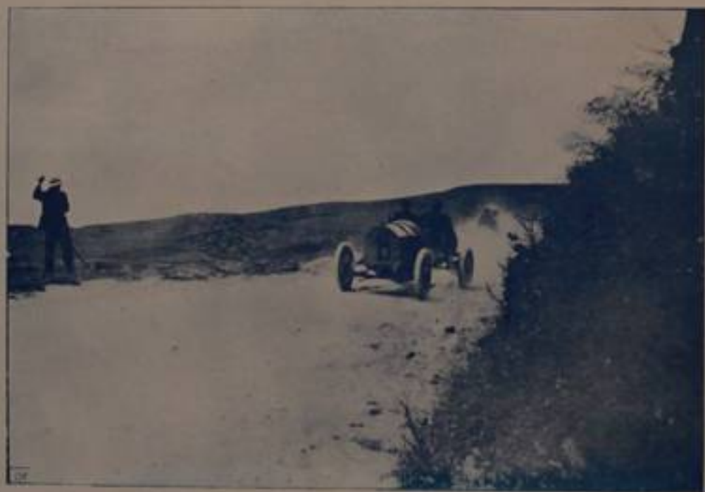
CARIOLATO, vincitore, su "Franco,, in corsa