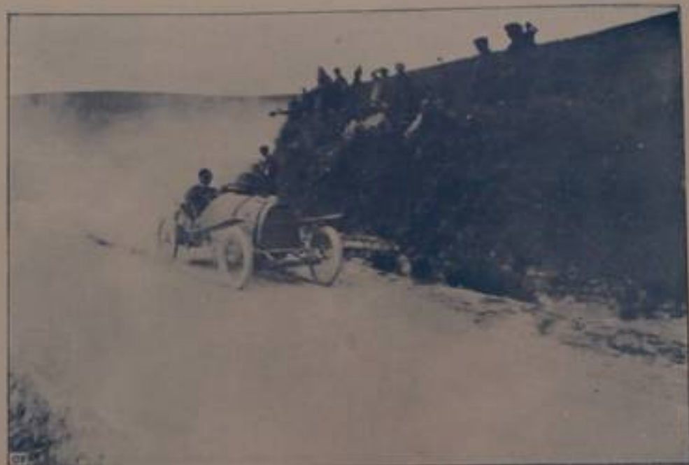
BOUX, su "Peugeot,, in virage