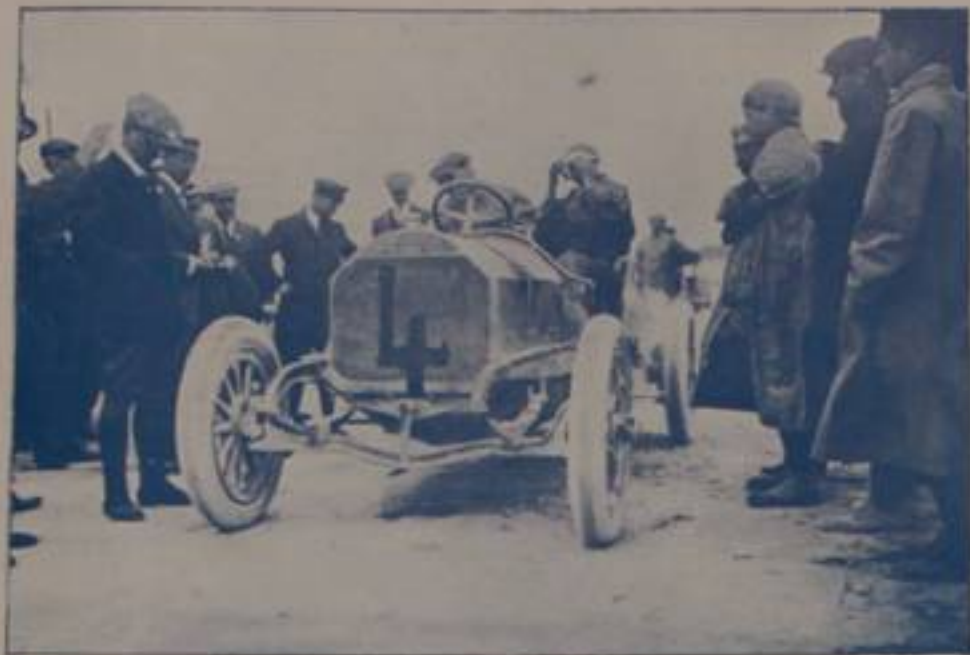
DE SETA, su "Spa.,