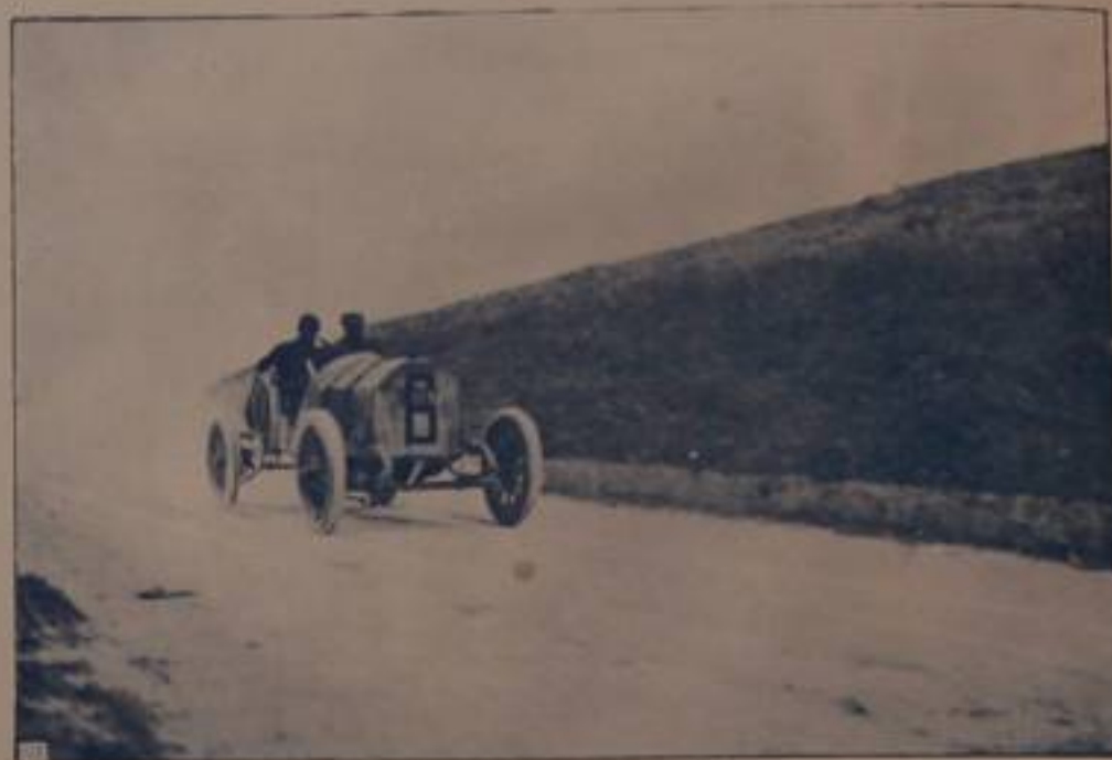
CARIOLATO, vincitore, su "Franco,, in corsa