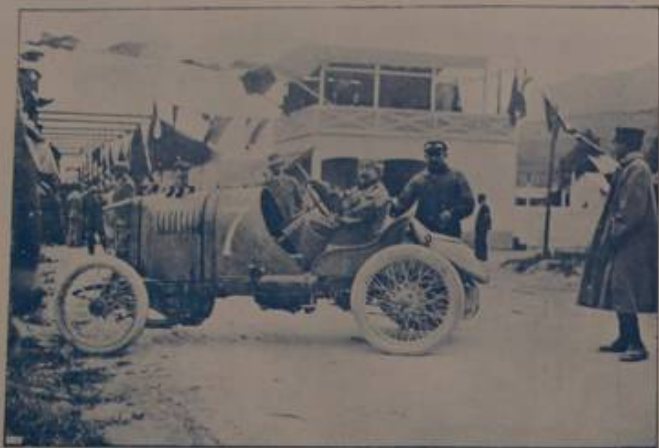
BOILLOT, vincitore della coppa Vetturette, su "Peugeot,,