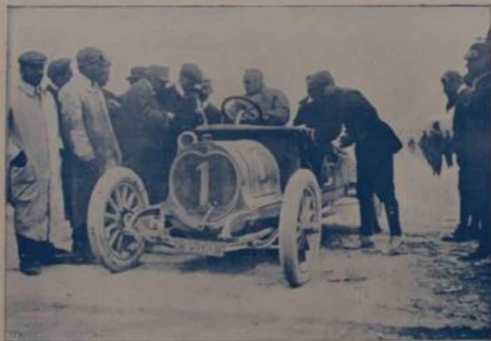
DE PROSPERIS, su "Sigma.,