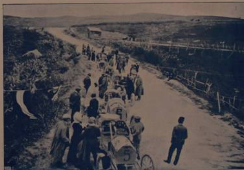
Prima della partenza