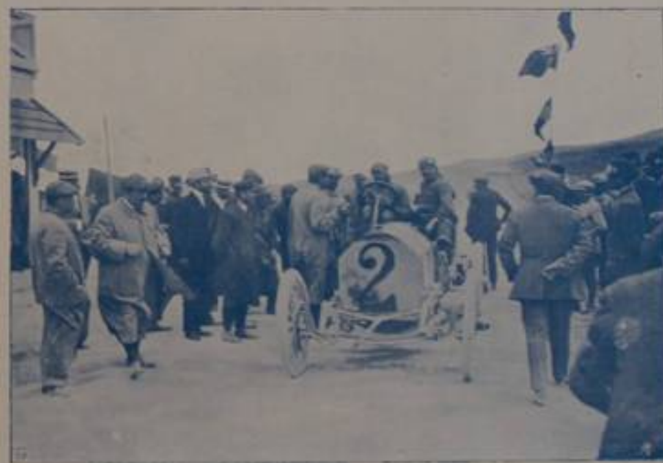
RAVIOLLO, su "Fiat.,