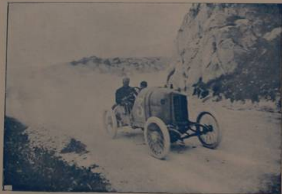
GIUPPONE, su "Peugeot,, in corsa