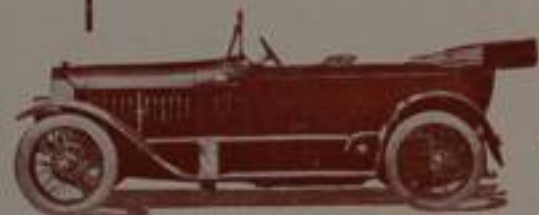
Siluro su Chassis Km. 120 HP