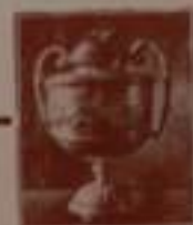
Coppa Conte Salemi