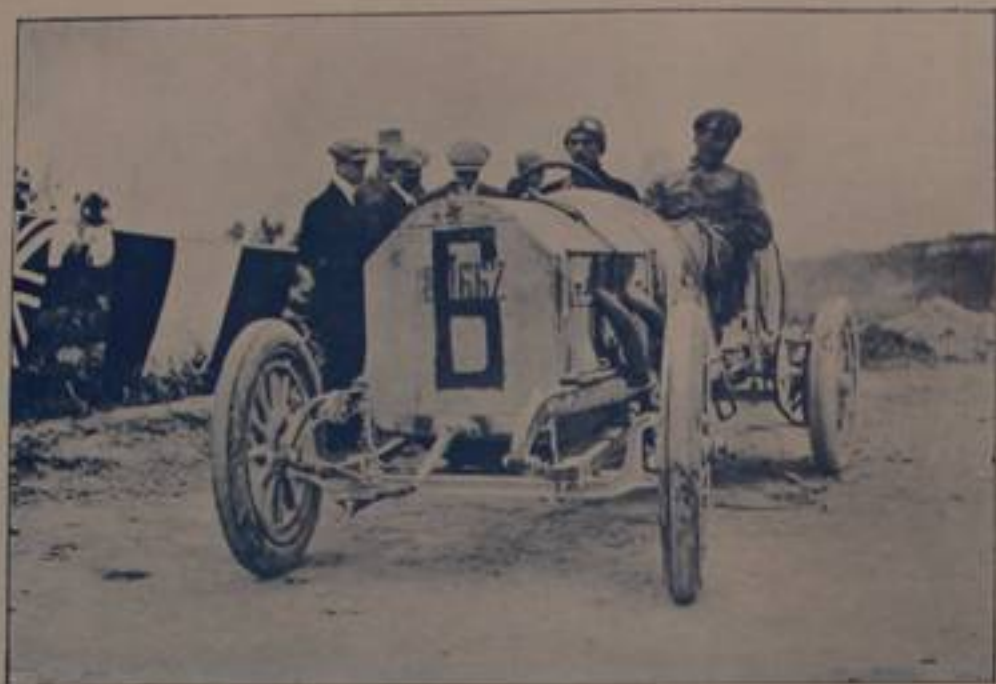
CARIOLATO, vincitore, su "Franco,,