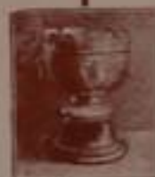
Coppa Re d'Italia

Sono le migliori perchè le più semplici = le più robuste e le più eleganti =