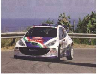
Andreucci e Andreucci in gara alla Targa Florio (Foto:)