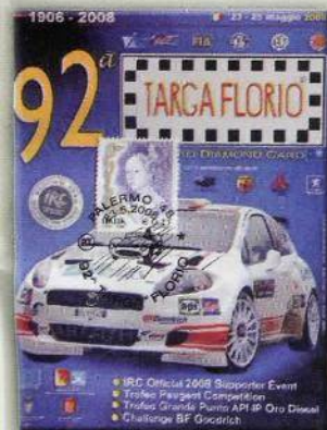
Il poster ufficiale del 2008 con annullo filatelico. La Targa entra nell'orbita IRC come "official supporter"