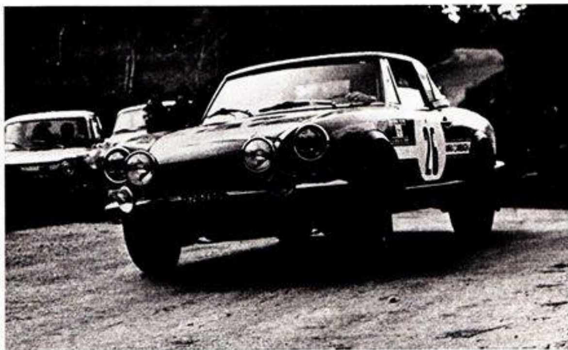
Cambiaghi-De Dominicis un equipaggio sempre più avanti nelle classifiche, seconde classificate nella Coppa delle Dame.