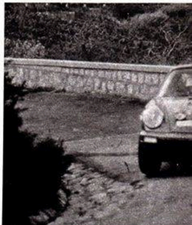
Positiva gara per la Carrera di Iccudrac approntata dalla Porsche Floridia di Palermo.

Il debutto della Beta ha rivelato la buona competitività della vettura che verrà omologata ai primi di Aprile.