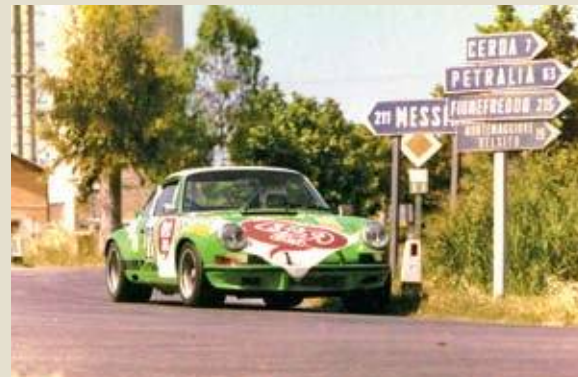
Terzo posto nel 1974 per la Porsche dei palermitani Restivo e "Apache" (Targapedi/Effemodels).