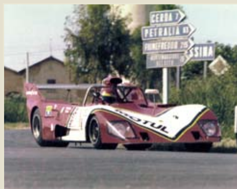
Sfortunata protagonista dell'edizione 1974 è la Lola di Giorgio Pianta e Pino Pica (Targapedi/Effemodels).